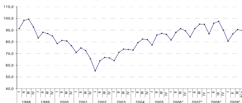
Gráfico 2. Índice de Horas Trabajadas (IHT), base 1997=100